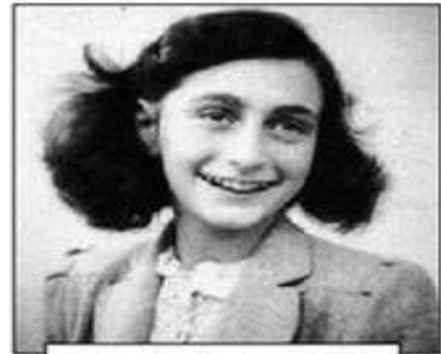
Junio, 1929 – marzo, 1945